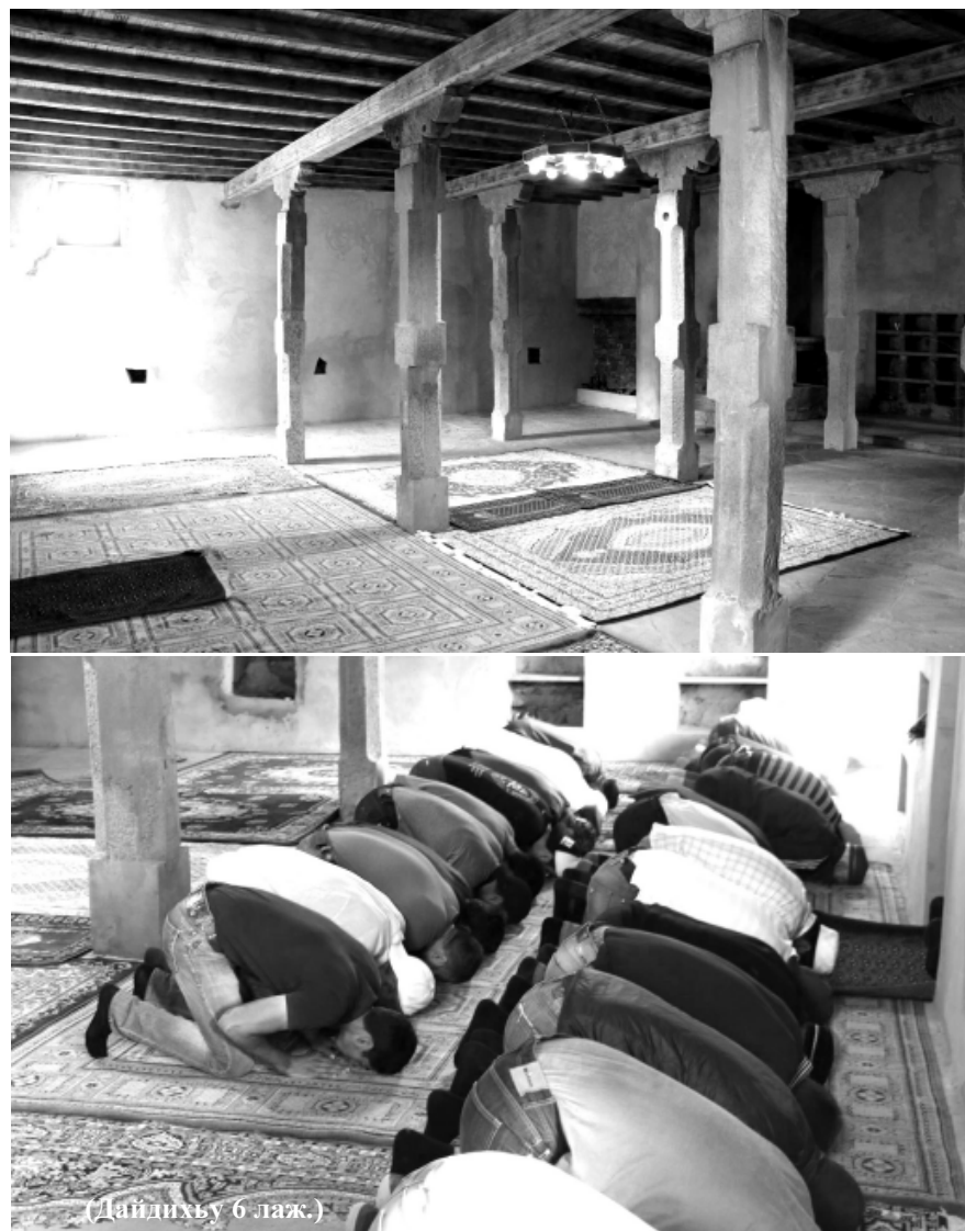
(Дайдихъу 6 лаж.)

Магъи дургъуну дур чарил ттурцIардий бивхъусса чIулттал. МихIрабгу ккурккину къабувну, рях-бавчIуну бувну бур, ялув къупгу бувну. Ухсав-